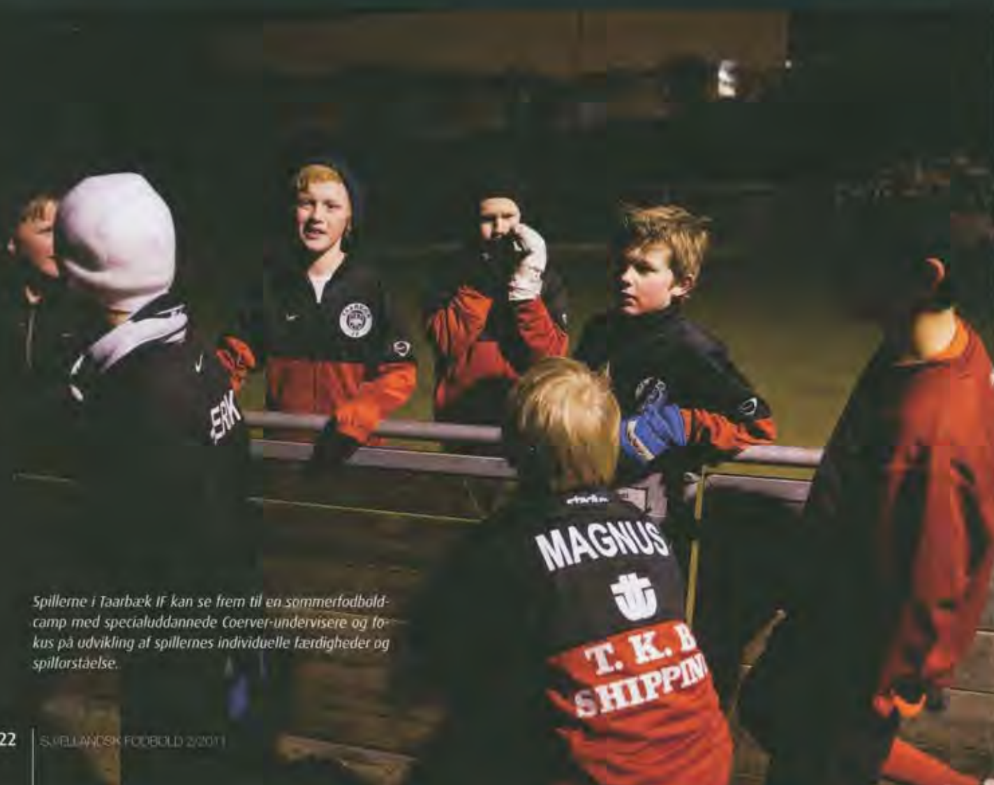
Spillerne i Taarbæk IF kan se frem til en sommerfodbold-camp med specialuddannede Coerver-undervisere og fokus på udvikling af spillernes individuelle færdigheder og spillorståelse.

At indsatsen ikke sker forgæves understreges i høj grad af, at