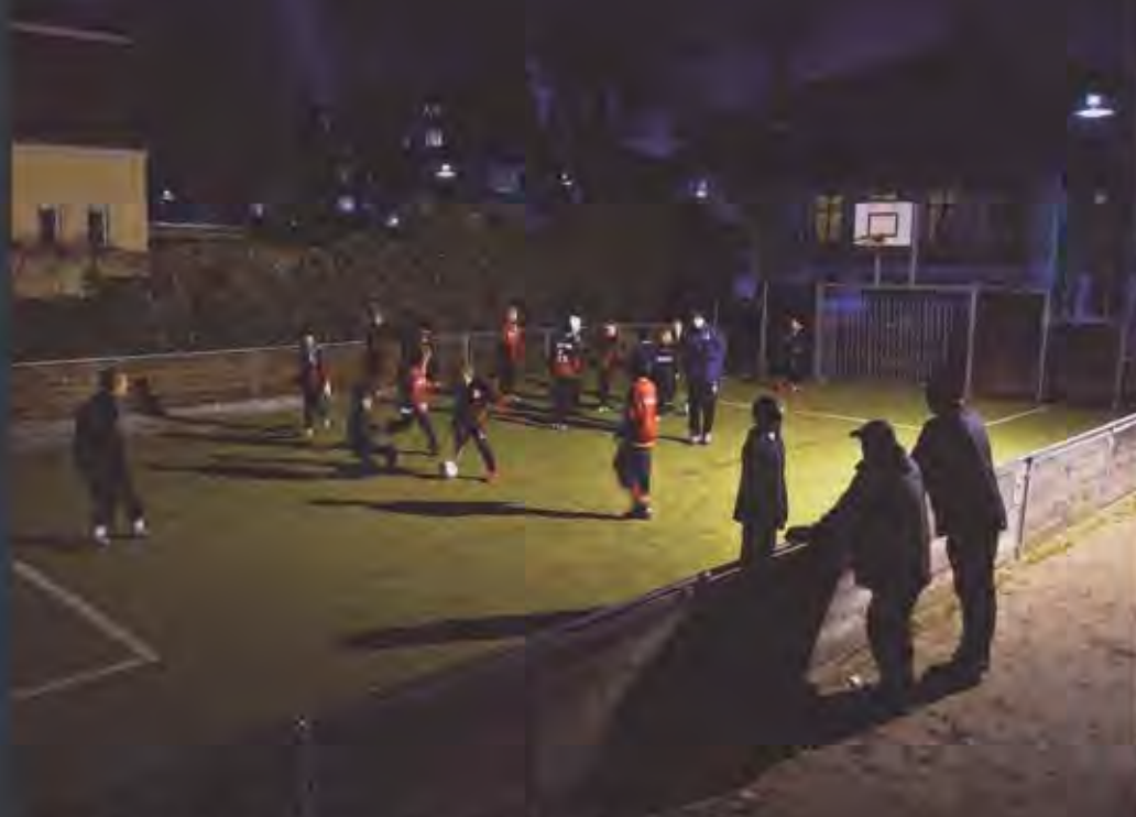
Taarbæk Skole er blevet så begejstret for ideen bag Fair Talk, at skolen nu har integreret tankegangen i dens eget arbejde med børnene.

Udover byens særdeles beskedne indbyggertal på omkring 1.500 er klubben hæmmet af, at den lokale skole kun tilbyder 0. til 6. klasse, hvorefter eleverne flyttes til større skoler i eksempelvis Skovshoved og Lyngby. Ofte flytter de